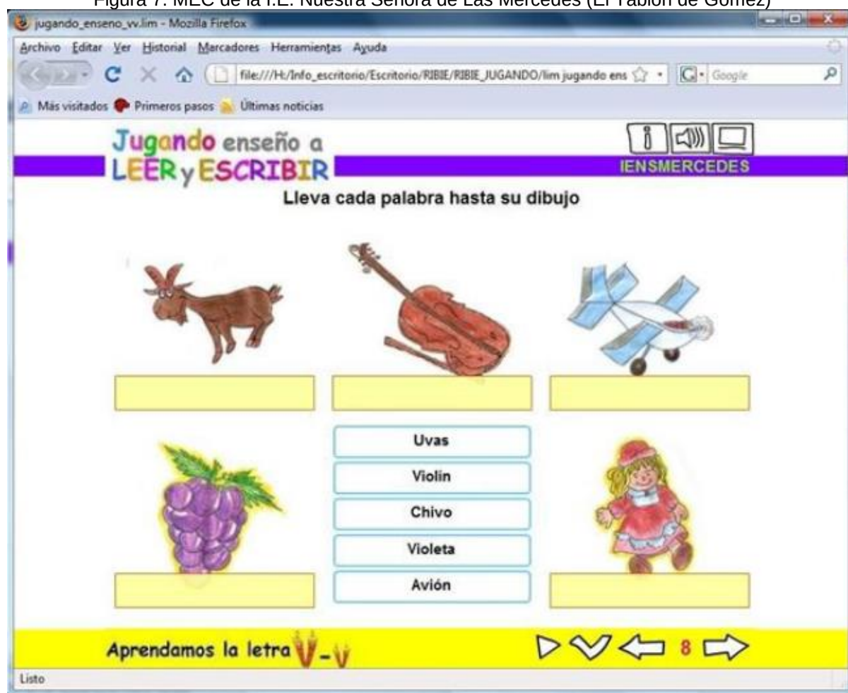
Figura 7. MEC de la I.E. Nuestra Señora de Las Mercedes (El Tablón de Gómez)

Las actividades educativas en el marco de las cuales se desarrollan los MEC muestran las transformaciones pedagógicas que se pueden lograr con la ayuda de estas tecnologías, siempre y cuando se asuma que el centro no está en las TIC sino en la intención con la que se utilizan.