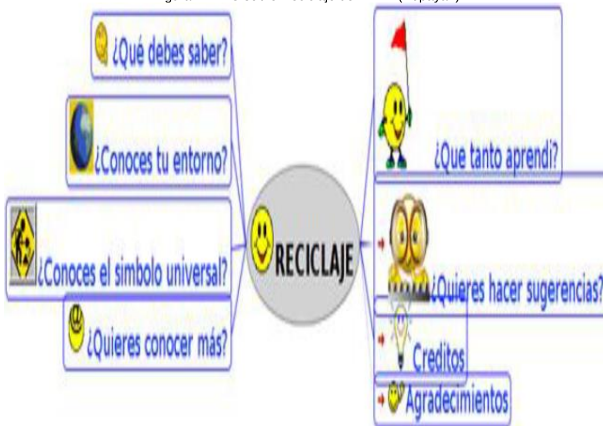
Figura 4. MEC sobre Reciclaje del INEM (Popayán)

Por su parte, los docentes del Instituto Nacional de Educación Media Diversificada (INEM) Francisco José de Caldas de Popayán, desarrollaron sus actividades en torno al tema del Reciclaje, lo que llevó a que los estudiantes realizarán entrevistas a una cooperativa de recicladores, hicieran una visita al relleno sanitario de la ciudad, consultarán en la alcaldía y el consejo municipal sobre las políticas de manejo de los residuos, y organizarán debates en la institución educativa sobre el tema. Al igual que el anterior MEC, este contiene información en forma de texto y presentaciones que los docentes dieron a sus estudiantes, las guías de las actividades, información recogida y organizada por los estudiantes.