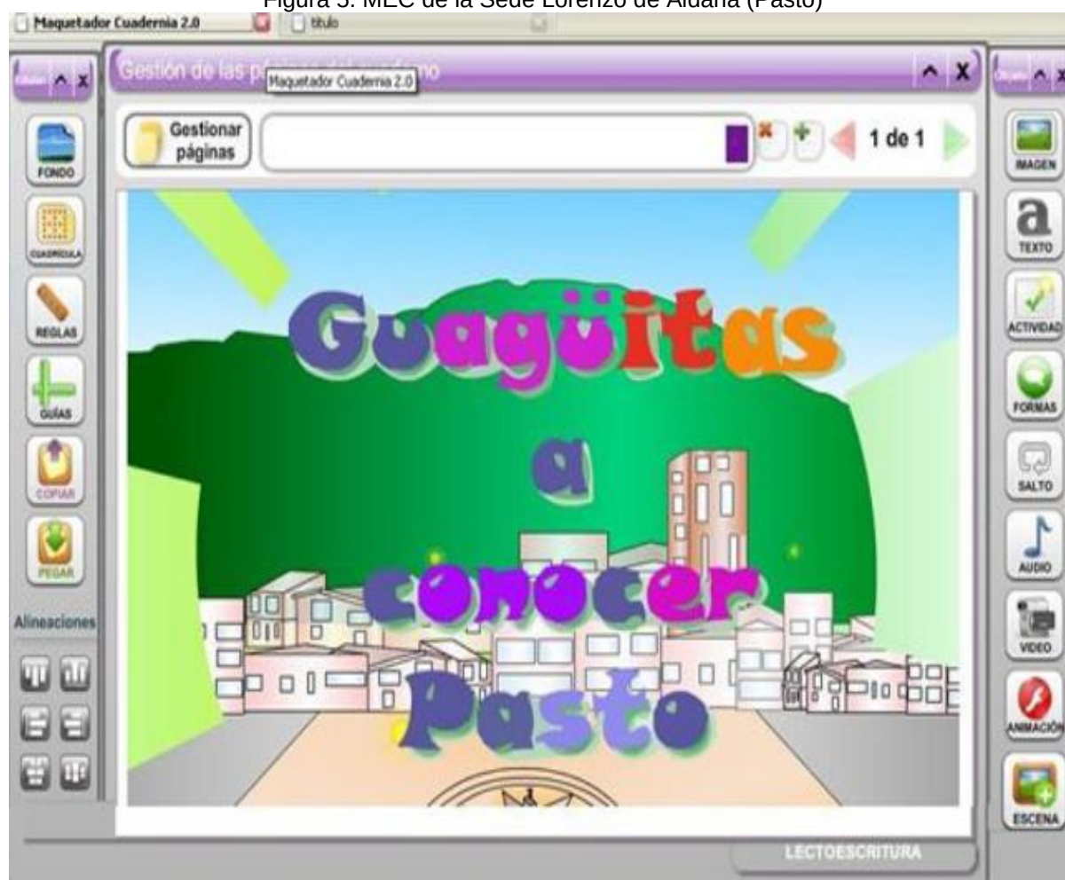
Figura 5. MEC de la Sede Lorenzo de Aldana (Pasto)

Haciendo Cuentas te Cuento fue un trabajo realizado por los centros educativos Aguacillas y Buenavista Rinconada del municipio de San Bernardo (Departamento de Nariño). Ellos se unieron en una experiencia conjunta a través de la cual los estudiantes de tercero generan e intercambian material educativo computarizado como refuerzo de las operaciones básicas en matemáticas, desde el análisis y resolución de situaciones del contexto. El programa que involucran para este trabajo es EdiLIM.