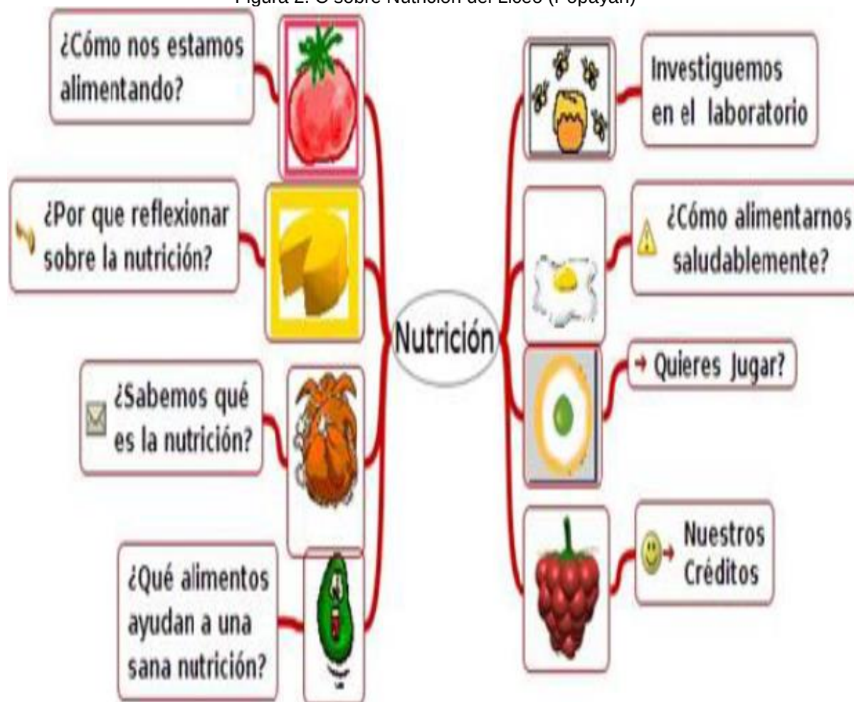
Figura 2. C sobre Nutrición del Liceo (Popayán)

Los docentes del Liceo Alejandro de Humbolt (Popayán) desarrollaron su proyecto en torno al Valor Nutricional de los Alimentos con los estudiantes de Grado 10° (ver figura 3).