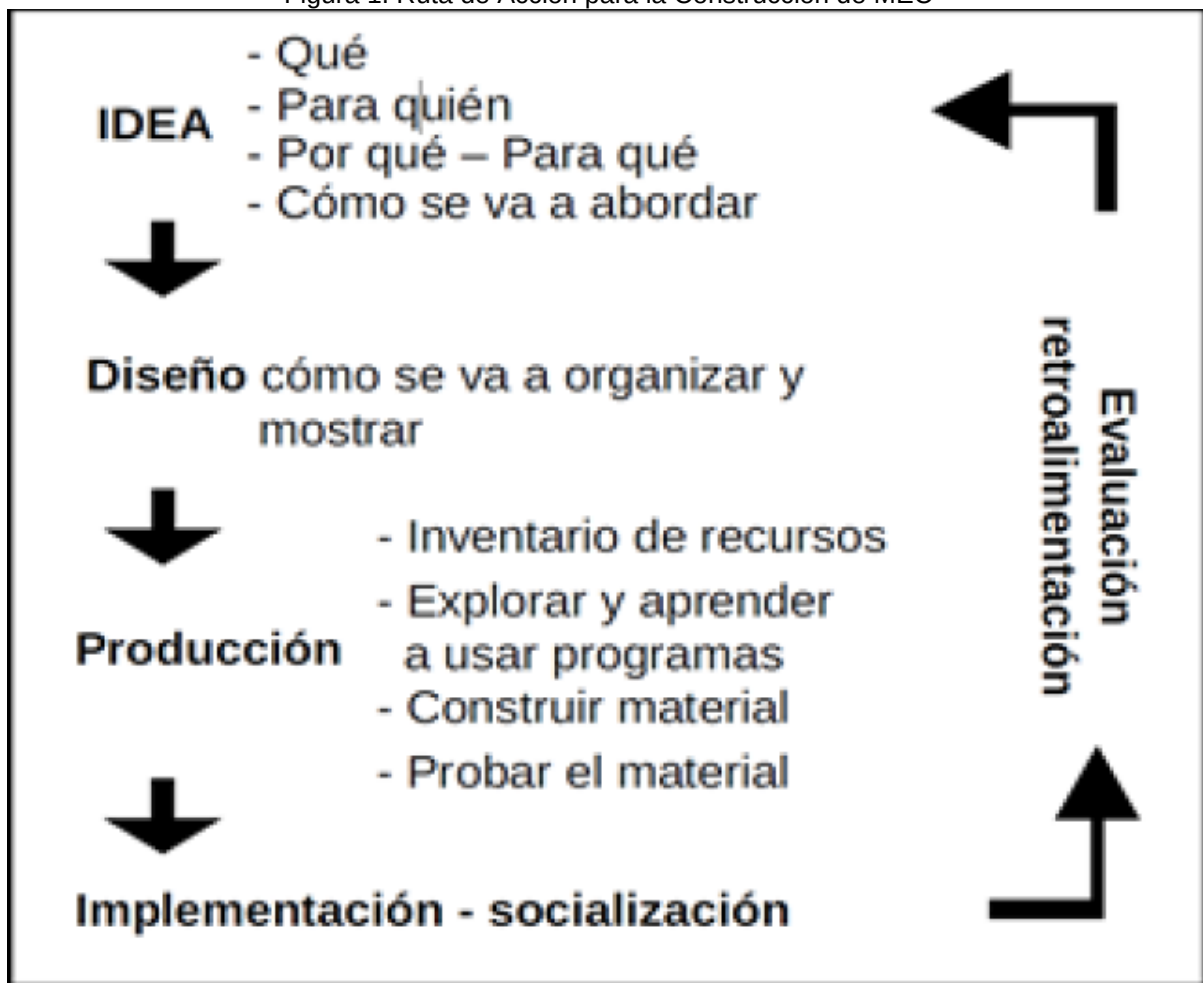
Figura 1. Ruta de Acción para la Construcción de MEC

el marco de las cuales se elaborará el MEC. Una vez definido esto, se sugiere seguir la ruta de acción que se presenta a continuación: